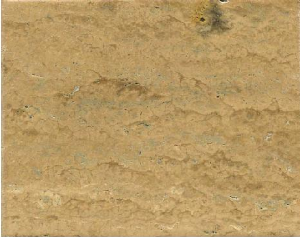
Localidad Mesa del Baile, mpio. Peñamiller, Qro. Mosaico con buen brillo y pulido